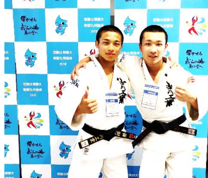
【夏季全国大会特集号】の写真是、引率された顧問の先生にご協力いただきました。