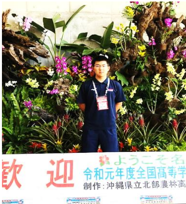
歓迎 令和元年度全国高等学校 制作: 沖縄県立北部農林高