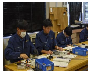
実習風景 3 (電気電子科)