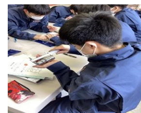
実習風景 4 (機械科)