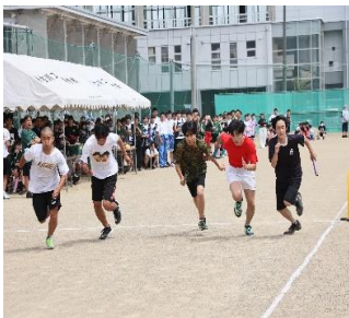
クラス対抗リレー競技