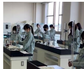
実習風景 5 (化学技術科)