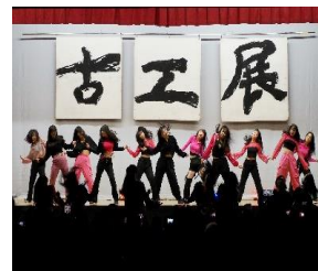
開会式 (ダンス部公演)