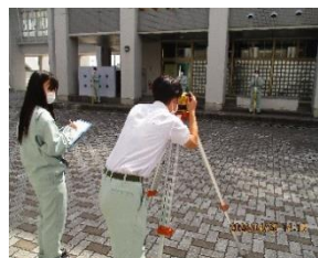
実習風景 1 (土木情報科)