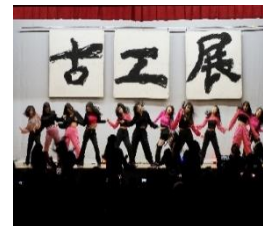
開会式（ダンス部公演）