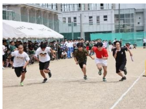
クラス対抗リレー競技