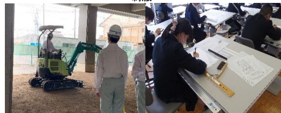
実習風景 1(土木情報科)