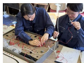
実習風景 3(電気電子科)