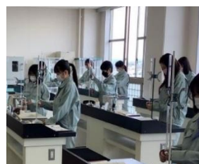
実習風景 5(化学技術科)